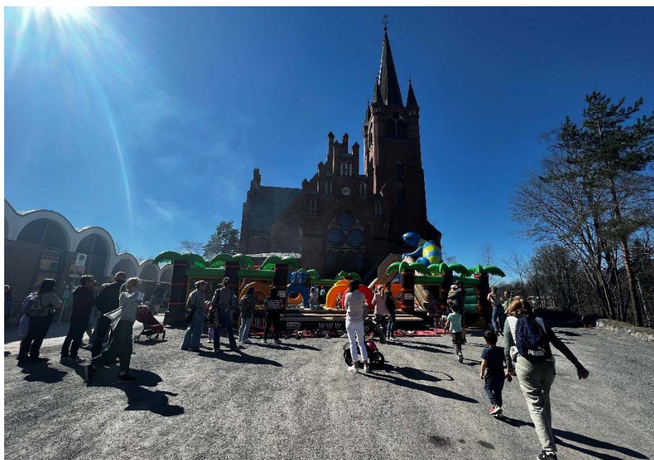
Bildet fra Vårfesten 2024 (Høvik Kirke)

Vel møtt til vårfest i og rundt kirken med gode naboer!